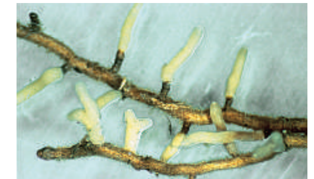
Abb. 367.2 Mykorrhiza. Pilzfäden bilden ein Geflecht um die Wurzelspitzen einer Kiefer.

Pilze gehen auch mit Landpflanzen Symbiosen ein. So sind z. B. Birkenpilz und Birke, Butterpilz und Kiefer sowie Steinpilz und Fichte aneinander angepasst. Die Symbiose findet im Wurzelbereich der Pflanzen statt und wird Mykorrhiza genannt. Die symbiotischen Pilze bilden an den Wurzelspitzen der Bäume ein Geflecht aus Zellfäden, das Pilzmycel (Abb. 367.2). Etwa 80 % aller Blütenpflanzen, darunter auch die meisten Gemüsepflanzen, haben eine Mykorrhiza, bei der die Zellfäden, das Pilzmycel, direkt in die Zellen der Wurzelrinde eindringen. An den Kontaktbereichen zwischen Wurzeln und Pilzgeflecht fehlen die Wurzelhaare, deren Aufgabe die Pilzfäden übernehmen. Mit ihrer großen Oberfläche nehmen sie Wasser und Ionen auf, welche der Pflanze über die Pilzfäden unmittelbar zugeführt werden. Die Mykorrhizapilze schützen nach dem Eindringen die empfindlichen Feinwurzeln außerdem vor infektiösen Pilzarten. Im Gegenzug nutzen die Pilze die von den Pflanzen gebildeten Kohlenhydrate.