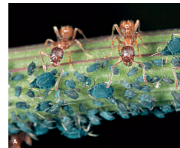
Abb. 367.1 Beispiele für Symbionten unter Tieren. A Ameisen und Blattläuse; B Putzerlippfisch an einem Barsch

In den Flechten leben Algen mit Pilzen zusammen. Das Pilzmycel gibt der Flechte ihre Form und nimmt Wasser auf. Die Flechte sondert organische Säuren ab, welche aus dem Untergrund Ionen lösen. Die zwischen den Pilzfäden lebenden Algen sind auf diese Mineralstoffe angewiesen. Der Pilz ernährt sich von den energiereichen organischen Stoffen, welche die Algen bei der Fotosynthese synthetisieren. Obwohl die Algen stark vom Pilz dominiert werden, ermöglicht die besondere Lebensgemeinschaft das Leben an Standorten, an denen Algen und Pilze isoliert voneinander nicht leben könnten. Einige Flechten besiedeln extreme Lebensräume in der Arktis, in Wüstengebieten und auf Geröllhalden in den Hochgebirgen.