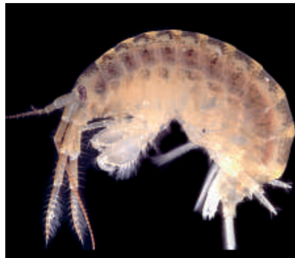
Abb. 366.2 Großer Höckerflohkrebs

Die zwischenartliche Konkurrenz ist auch bei Pflanzen als biotischer Faktor wirksam: Der Stickstoffeintrag in un-